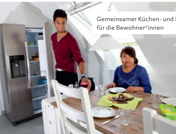
Gemeinsamer Küchen- und Essbereich für die Bewohner*innen

Allen Bewohner*innen stehen gemütlich eingerichtete Einzelzimmer zur Verfügung, die sie individuell gestalten können. Dazu gehören außerdem liebevoll ausgestattete Gemeinschaftsräume sowie ein schönes Außengelände. Kurz: Ein behagliches Zuhause, ein Ort zum Ankommen und sich Entfalten!