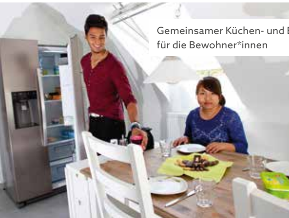
Gemeinsamer Küchen- und Essbereich für die Bewohner*innen

Allen Bewohner*innen stehen gemütlich eingerichtete Einzelzimmer zur Verfügung, die sie individuell gestalten können. Dazu gehören außerdem liebevoll ausgestattete Gemeinschaftsräume sowie ein schönes Außengelände. Kurz: Ein behagliches Zuhause, ein Ort zum Ankommen und sich Entfalten!