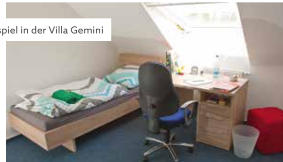
Wohnbeispiel in der Villa Gemini

In den Angeboten der WeltRäume geht es darum, positive Beziehungen zu erfahren, auf dieser Grundlage schrittweise Eigenständigkeit einzuüben und selbstständig zu werden. Dazu gehört auch, sich schulisch und beruflich zu orientieren, eine Ausbildung zu machen und seinen Lebensunterhalt durch eigene Arbeit zu verdienen. Dafür bietet das Berufsbildungswerk Südhessen in Karben mit seinen vielfältigen Möglichkeiten der Berufsorientierung und Ausbildung ideale Voraussetzungen.